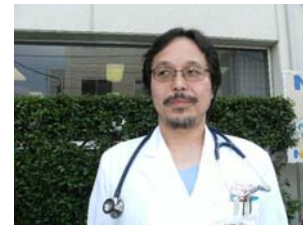
榎先生(内科・循環器科)